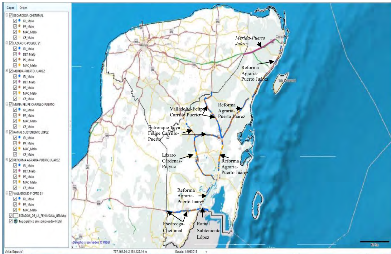
Ilustración 3. Mapa de ubicación de la red federal libre donde no se cumple con los rangos de aceptación de las variables.